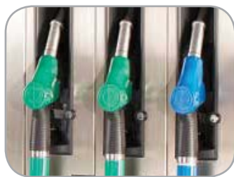
Замки на пистолеты