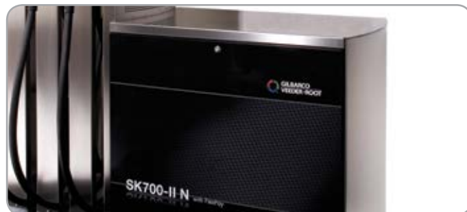
Панели из нержавеющей стали