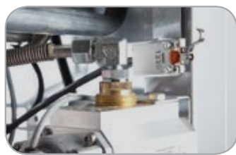
Сигнализация открытия дверец