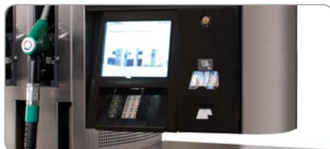
Модули оплаты (CRIND)